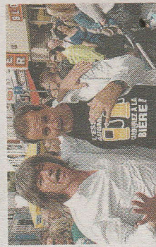
Avec Bouldou, ils font la paire ■ GDS

me il l'avait déjà fait dans le cadre de notre série spéciale Cloclo. Le public a bien ri. Delaude nous a prouvé une fois de plus que "trop is